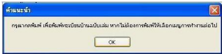
รูปที่ ๗ คำแนะนำเพื่อพิมพ์ทะเบียนบ้าน

ระบบจะดำเนินการเพิ่มรายการบ้านที่ผ่านการบันทึกและตรวจสอบแล้วพร้อมข้อมูลทะเบียนรับแจ้งปลูกสร้างบ้านใหม่ลงในฐานข้อมูลและแสดงข้อความแจ้งผู้ปฏิบัติงานเพื่อดำเนินการพิมพ์สมุดทะเบียนบ้าน